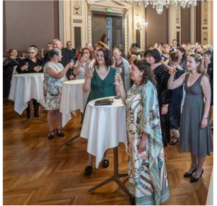
Käsityögaala elokuussa 2024 Tampereen Raatihuoneella.

Arja Tiitola, vastaava neuvoja 31.8.2023 asti Heta Perälä, neuvoja, osa-aikainen, määräaikainen 31.8.2023 asti